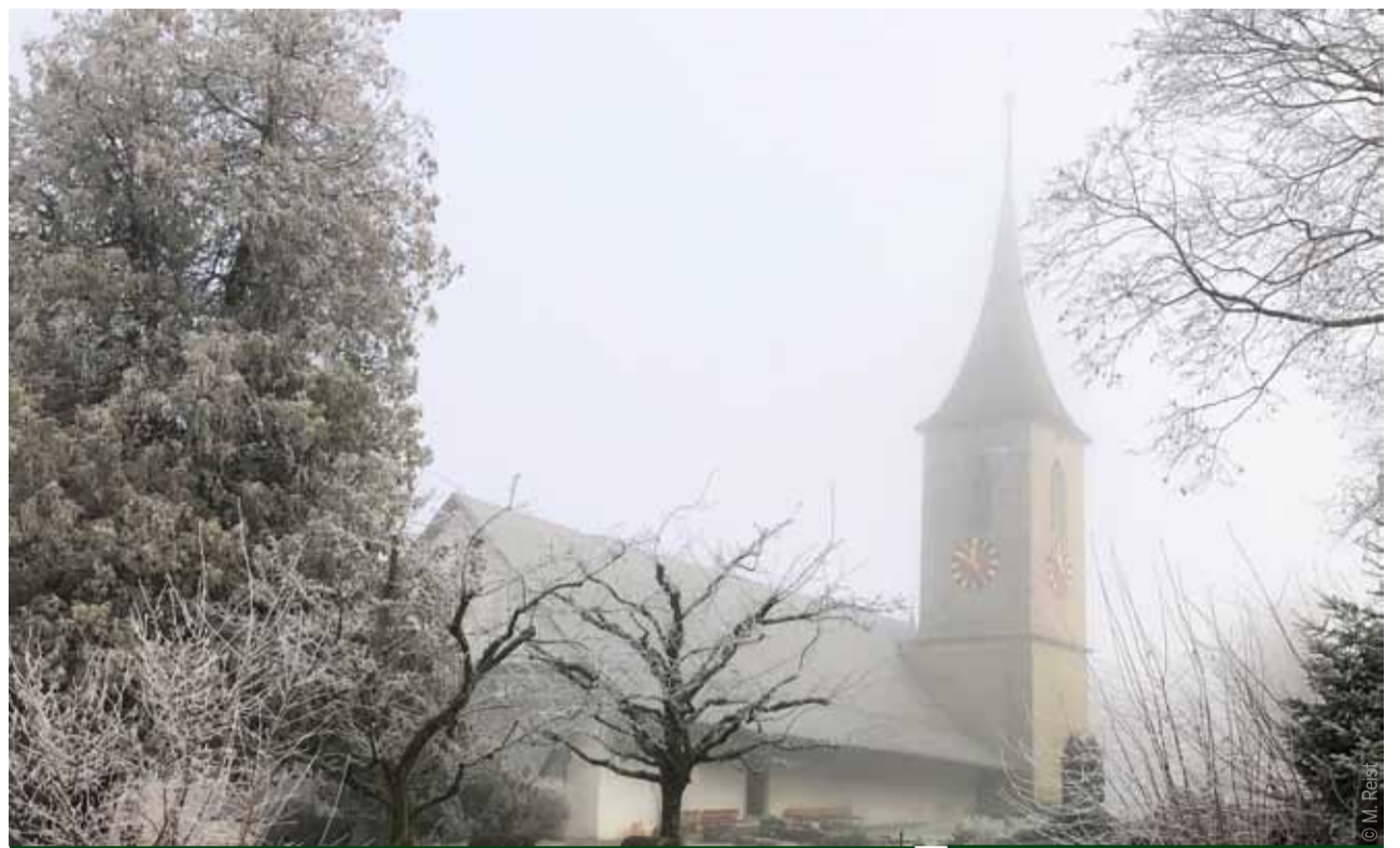
MUSIKALISCHES IN DER KIRCHE

Weihnachtsgottesdienst für Kinder und Erwachsene am 3. Advent.